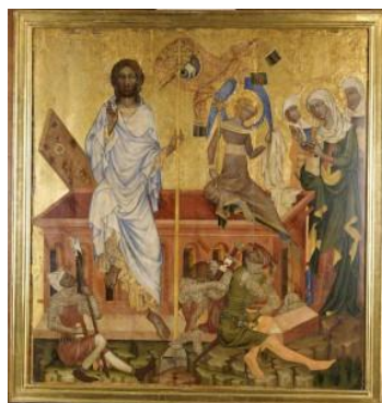
Obraz symbolizující Ježíšovo zmrtvýchvstání z roku 1350 Autor: Mistr vyšebrodského oltáře

Příprava na Velikonoce však začíná mnohem dřív, tzv. Popeleční středou, která symbolizuje postní dobu a trvá 40 dní (kromě neděle). Půst v křesťanském smyslu se netýká jen zdržení se jídla a abstinence, ale člověk by měl pracovat i na proměně a obnově svého života. Půst pak vrcholí v pašijovém týdnu (týden, kdy došlo k ukřižování a zmrtvýchvstání Ježíše Krista), tedy velikonočním týdnem, kde každý den v týdnu má svůj význam vycházející z historie a tradice.