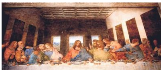
Leonardova freska Poslední večeře Páně v refektáři milánského konventu Santa Maria delle Grazie

Zelený čtvrtek má velký význam. Je to den, kdy se podle Bible konala poslední večeře, při níž byl Ježíš Kristus zatčen. S tímto dnem je spojena i symbolika odpouštění, kdy byli bývalí kající se hříšníci přijímání zpět mezi věřící. Se Zeleným čtvrtkem se také nejvíce pojí tradice a pověry: