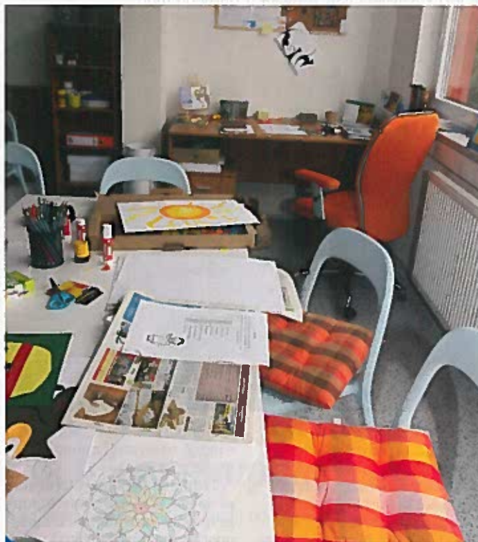
Klienti se v centru na Střížkově pod vedením zkušené pracovníce mohou věnovat např. výtvarným činnostem

Denní stacionář pro lidi postižené Alzheimerovou chorobou nebo podobným typem onemocnění v Hejnické ulici na Střížkově je ambulantní sociální služba poskytovaná od roku 2011 Střediskem sociálních služeb MČ Praha 9. Senioři, jichž je zde v současné době patnáct, tady tráví dny v moderním prostředí, které je přizpůsobené jejich potřebám. Přímou péči jim v pracovní dny, kdy se jim nemohou věnovat rodinní příslušníci, poskytují tři pracovníci v sociálních službách a sociální pracovníce. Klienti sem mohou docházet po uzavření smlouvy o poskytování sociální služby v Denním stacionáři Hejnická ve dny, které si předem se sociální pracovníci sjednají.